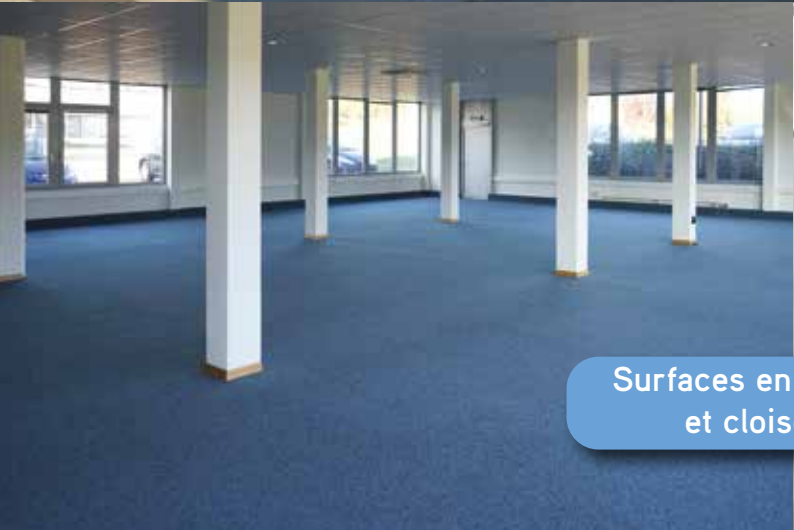
Surfaces en open space et cloisonnées