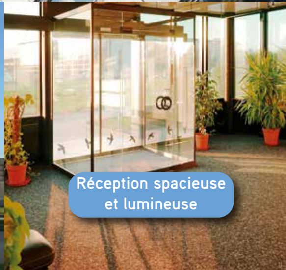
Réception spacieuse et lumineuse