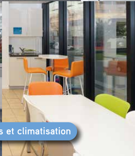
Surfaces complètement aménagées, y compris faux plafonds et climatisation