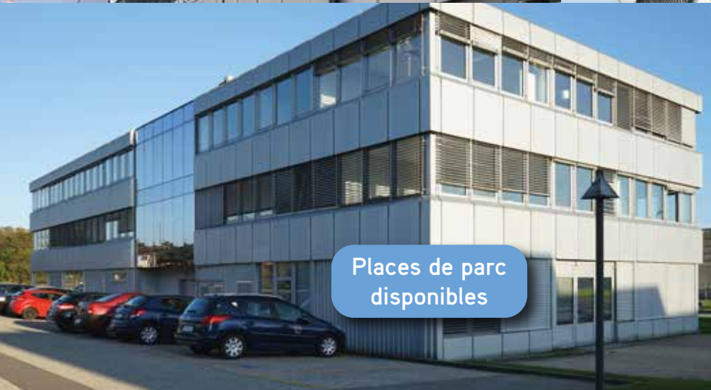
Places de parc disponibles